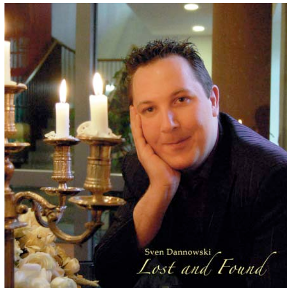
Abbildung 2: Beispiel für eine professionelle Cover - Card (Vorderseite)

Ob Sie nur eine Covercard oder ein mehrseitiges Booklet erstellen bleibt Ihnen überlassen. Auf die Vorderseite (die nach außen zum Kunden Zeit) befindet sich das eigentliche Cover in Form eines Fotos oder einer Grafik, die zum Thema der CD passt. Auf diesem Cover sollte auch der Künstlername und der CD – Titel vermerkt sein.