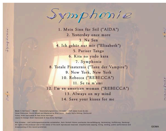
Abbildung 4: Beispiel für eine Inlay – Card

Alle weiteren Angaben sind freiwillig. Bei Rückfragen können Sie damit argumentieren, dass mehr Angaben mit dem grafischen Konzept Ihrer CD nicht vereinbar gewesen wären, und Sie die notwendigen Angaben deshalb auf die Cover – Card bzw. das Booklet beschränkt haben.