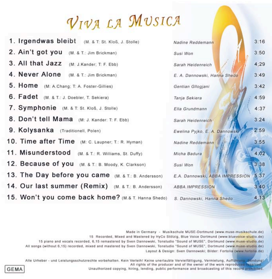
Abbildung 3: Rückseite einer Cover - Card mit Gastmusikern und Fremdaufnahmen

Hier noch ein Beispiel für die Rückseite einer Cover – Card einer CD, bei der viele verschiedene Künstler und Fremdaufnahmen dabei waren: